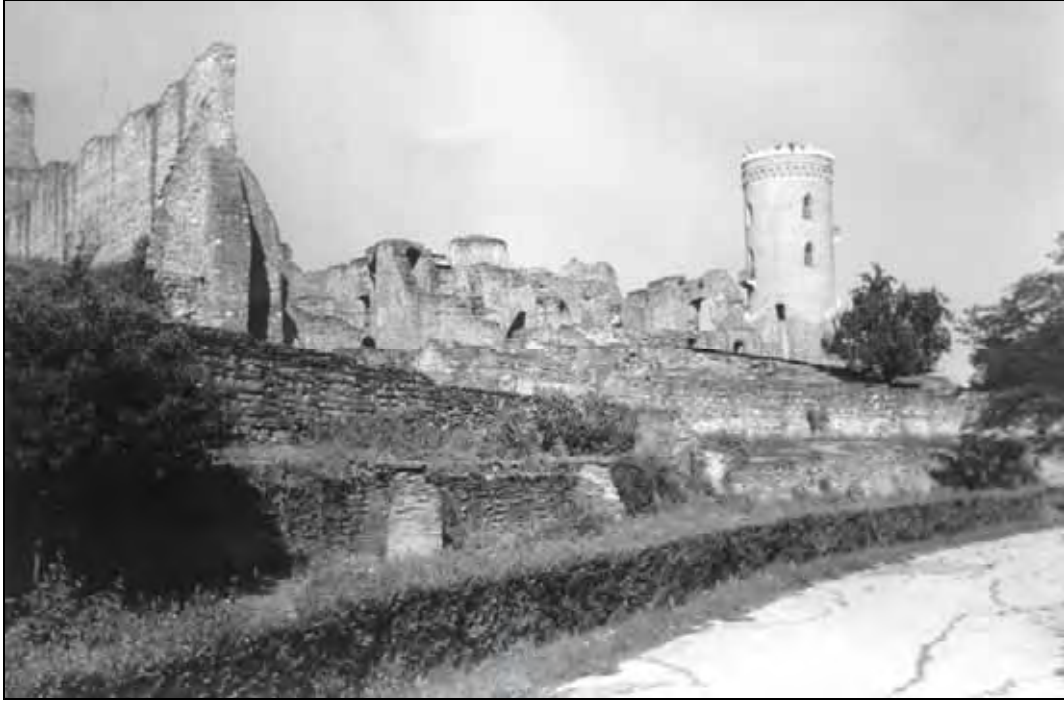
Fig. 2. Vedere dinspre Parcul Chindia (foto original).