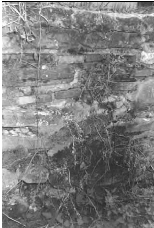
Fig. 3. Plante pioniere pe ruine ( stelaria media , erigeron annuus , veronica hederifolia ).

Mihail Dumitru Str. Revoluției, bl. C 10, ap. 7 Târgoviște, jud. Dâmbovița România