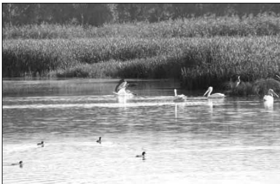
Fig. 2. Pelicani ( Pelecanus crispus ) și lișițe ( Fulica atra ) pe Balta Siliștioara (Corabia, Jud. Olt) Pelicans ( Pelecanus crispus ) and coots ( Fulica atra ) on Siliștioara Marsh (Corabia, Olt District)

Majoritatea speciilor identificate aici sunt incluse pe listele de conservare: European Threat Status – 49 de specii cu statut nesigur.