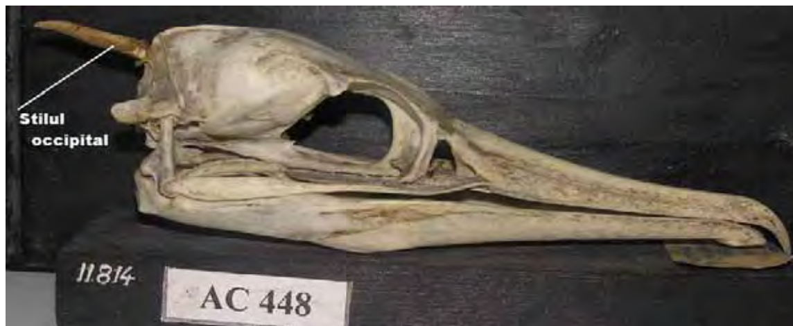
Fig. 2- Craniul de Phalacrocorax sp., vedere laterală, cu stilul occipital. (The skull of Phalacrocorax sp., lateral view, with occipital styl)

Pelicanii au un cioc foarte mare, prevăzut sub mandibulă cu un sac membranos larg. În momentul prinderii prăzii, peștele este introdus în acest sac și depozitat până la îngurgitare sau transportat ca hrană pentru pui. Craniul are o lungime de 450 mm, din care ciocul 360 mm. Ciocul este mai lung de 3-4 ori decât cutia craniană. Oasele craniului sunt sudate, robuste, dar și foarte ușoare. Narinele sunt situate la baza ciocului aproape de sutura frontonazală. Lacrimalele sunt unite cu oasele nazale, iar processus orbitalis oralis este foarte dezvoltat, lung, proiectat spre bara jugalului, dar nu este unit cu jugalul. Processus postorbitalis este dezvoltat, iar processus zygomaticus este mic.